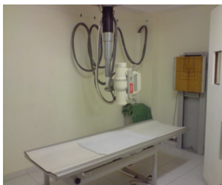
SALA DE RX