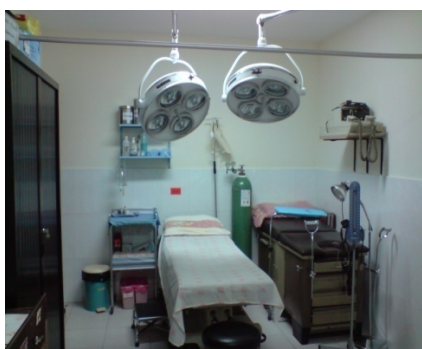
UNIDAD DE EMERGENCIAS