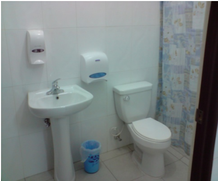
INTERIOR DE LAS HABITACIONES