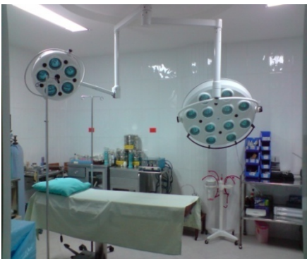
SALA DE OPERACIONES